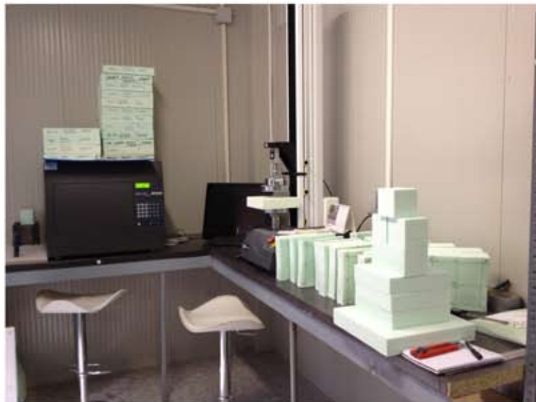
Lambdamètre - PC centralisant les mesures - Presse