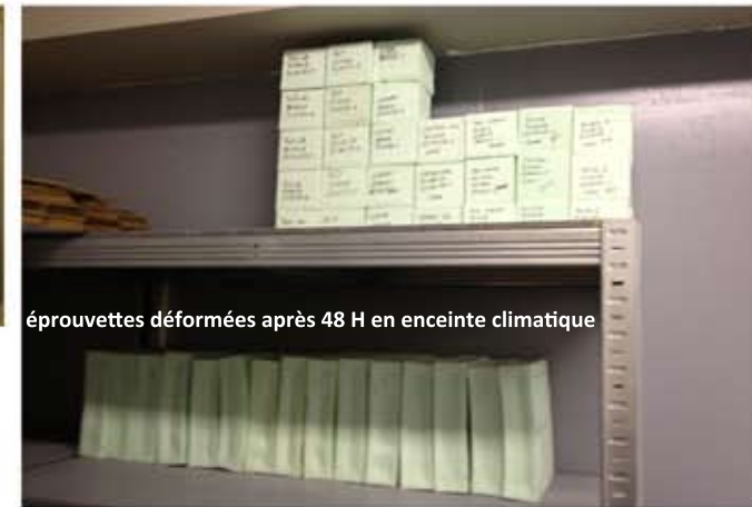
épreuves déformées après 48 H en enceinte climatique