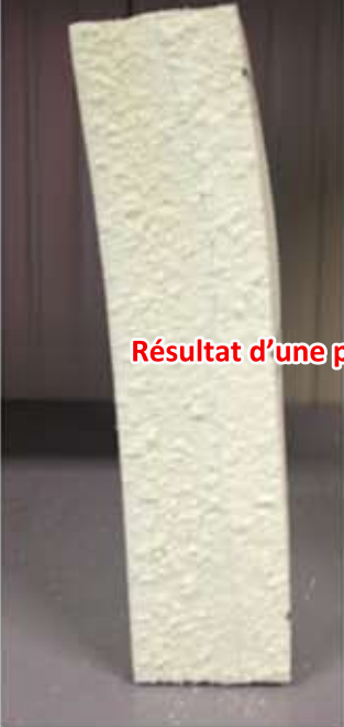
Résultat d'une projection en défaut de ratio !