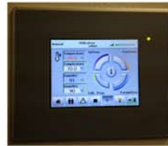
Tableau de contrôle de l'enceinte climatique 70 ° C - 90 % d'Hygrométrie